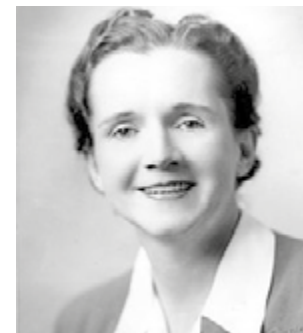
Autora del libro: Rachel Carson

La autora nació en 1907 en Pennsylvania y vivió en la granja de su familia, que, en su infancia, había explorado a fondo. Estudió Biología, pero, por los problemas económicos de sus padres en el comienzo de la Gran Depresión de 1928, tardó en graduarse y no pudo continuar los estudios de zoología y genética. Se dedicó a la enseñanza, y después, por recomendación de una de sus profesoras, comenzó a trabajar en el Servicio de Pesquerías. Su puesto consistía en escribir guiones educativos para un programa de