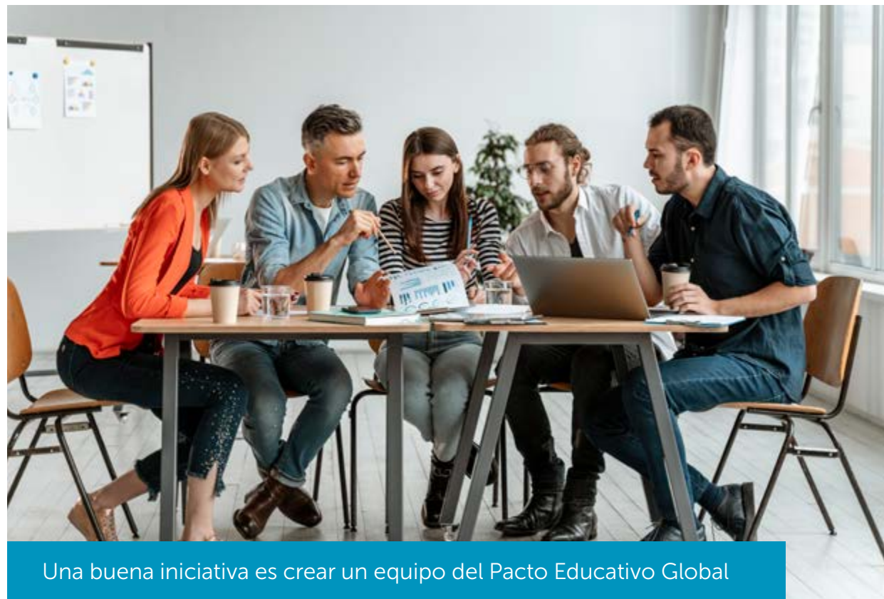
Una buena iniciativa es crear un equipo del Pacto Educativo Global

Después, cuando la comunidad educativa manifiesta cuál es el proyecto más pertinente, en ese mismo momento el equipo lo asume y lo desarrolla extensamente. No se puede emprender un proyecto significativo, que involucre a mucha gente, sin un plan. Hay