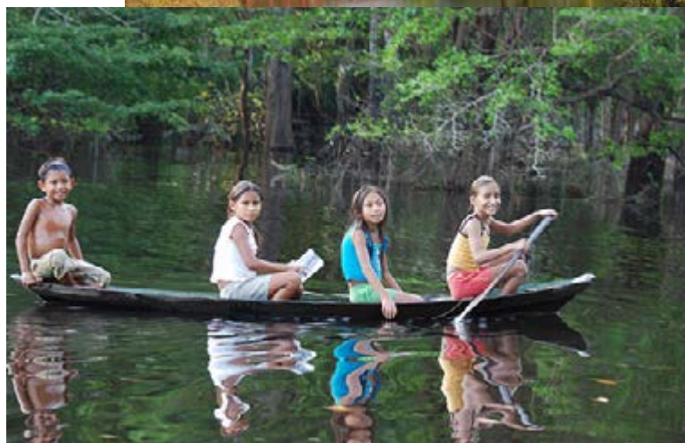
Pequeño pueblo de la región amazónica

su modo de ser, siempre callado como la mayoría de los indígenas.